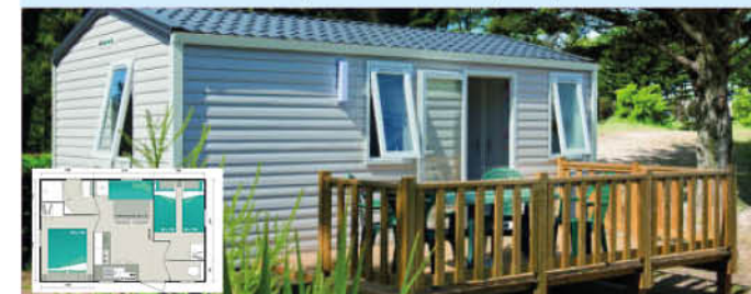
Venus (22 m 2 - 0-7 ans) - 4 pers.

Prévu pour l'accueil de 4 pers. 1 cuisine équipée : frigo congélateur, plaques gaz, vaisselle, micro-onde, cafetière électrique, chauffage électrique. 1 salle de bain avec douche, lavabo (WC séparé). 1 chambre avec 1 lit 140x190. 1 chambre avec 2 lits 80x190. 1 salon, 1 TV, coin repas. 1 terrasse couverte avec salon de jardin.