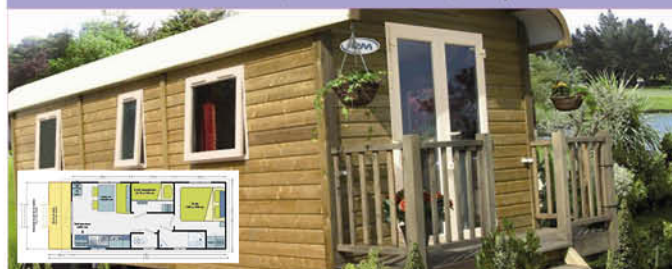
Roulotte (21 m 2 - 0-7 ans) - 4 pers.

Prévu pour l'accueil de 2 adultes + 2 enfants, elles comprennent : 1 cuisine/ séjour avec réfrigérateur, réchaud 4 feux gaz, micro-ondes, 1 salle d'eau avec lavabo, douche, 1 WC, 1 chambre avec 1 lit 140x180, 1 chambre avec deux lits simples superposés 70x180, à l'extérieur un salon de jardin.