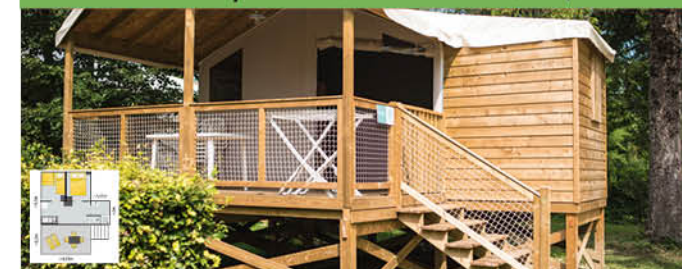
Cabane pilotis (22 m 2 - 0-7 ans) - 5 pers

Prévu pour l'accueil de 5 pers. 1 cuisine équipée : frigo, plaques gaz, vaisselle, micro-onde, cafetière, 1 salle de bain avec douche, lavabo, WC, chauffage électrique. 1 chambre avec 1 lit 140x190. 1 chambre avec 3 lits 80x190 dont 1 couchage en hauteur. 1TV. 1 terrasse couverte avec salon de jardin.