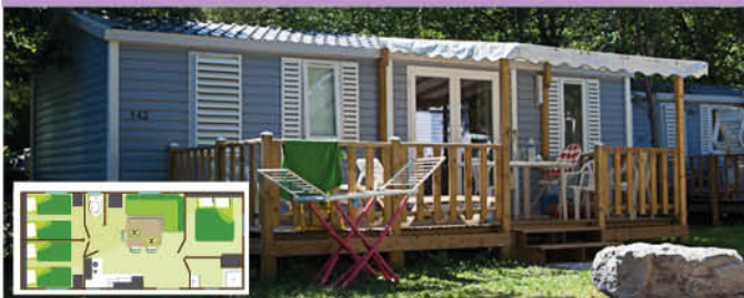
Family Premium (32 m 2 - 0-7 ans) - 6 (+2) pers.

Prévus pour l'accueil de 6 (+2)pers. TV, 1 cuisine équipée: frigo/congélateur, plaques gaz 4 feux, vaisselle, micro-onde, cafetière électrique, chauffage électrique, 1 salle de bain avec douche, lavabo (WC séparé). 1 chambre avec 1 lit 140x190. 2 chambres avec 2 lits 80x190 (approchables). 1 salon, coin repas transformable en lit 2 pers. 1 terrasse couverte avec salon de jardin.