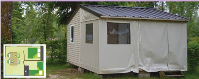
Tithome sans sanitaire (21 m 2 - 0-7 ans) - 5 pers.

Prévus pour l'accueil de 5 personnes, ils comprennent : dans la partie mobilhome 11 m 2 : 1 chambre avec lit 140x190, convecteur, penderie, 1 chambre avec 3 lits 80x190 en gigogne, convecteur, penderie dans la pièce de vie 11 m 2 (terrasse couverte ouvrable sur chaque côté) : cuisine équipée (micro-onde, frigo, plaque cuisson gaz/2feux, vaisselle, cafetière électrique) meuble de rangement, table et 5 chaises.