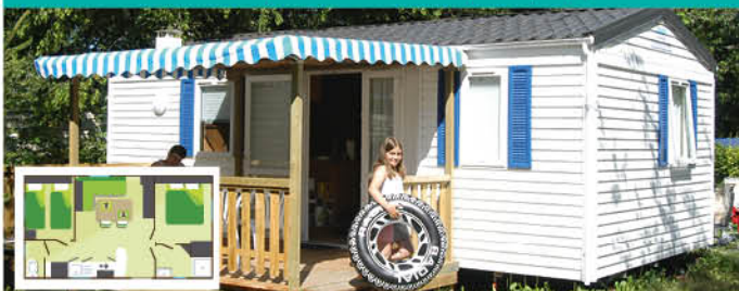
Premium (28 m 2 - 0-12 ans) - 4 (+1) pers.

Prévu pour l'accueil de 4 (+1) pers. 1 cuisine équipée : frigo, plaques gaz 4 feux, vaisselle, micro-onde, cafetière électrique, chauffage électrique. 1 salle de bain avec douche, lavabo (WC séparé). 1 chambre avec 1 lit 140x190. 1 chambre avec 2 lits 80x190. 1 salon, 1 TV, coin repas. 1 terrasse couverte avec salon de jardin.