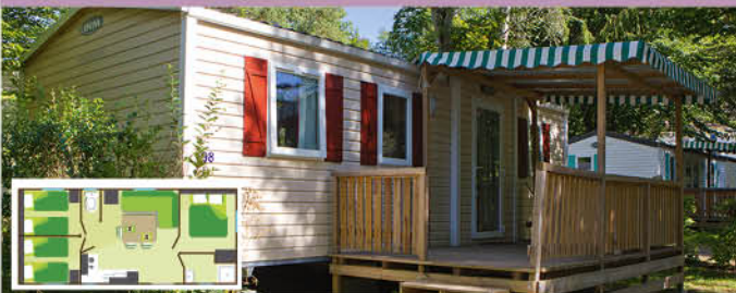
Family (30 m 2 - 0-12 ans) - 6 pers.

Prévus pour l'accueil de 6 pers. 1 cuisine équipée: frigo, plaques gaz 4 feux, vaisselle, micro-onde, cafetière électrique, chauffage électrique. 1 salle de bain avec douche, lavabo (WC séparé). 1 chambre avec 1 lit 140x190. 2 chambres avec 2 lits 80x190 (approchables). 1 salon, coin repas. 1 terrasse couverte avec salon de jardin.