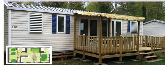
Family XL (40 m 2 - 0-7 ans) - 6 (+2) pers.

Prévus pour l'accueil de 6(+2) pers. avec TV, 1 cuisine équipée : frigo congélateur deux portes, plaque gaz 4 feux, vaisselle, micro-onde, cafetière électrique, lave-vaisselle, chauffage dans toutes les pièces. 2 salles de bain avec douche, lavabo (WC séparé). 1 chambre avec 1 lit 140x190. 1 chambre avec 2 lits 80x190. 1 chambre avec 1 lit 80x190 et 1 lit gigogne. 1 salon, coin repas transformable en lit. 2 pers. 1 terrasse couverte avec salon de jardin.