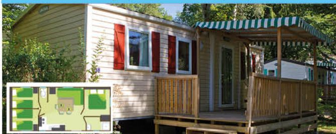
Family (30 m 2 - 0-12 ans) - 6 pers.

Prévu pour l'accueil de 6 pers. 1 cuisine équipée : frigo, plaques gaz 4 feux, vaisselle, micro-onde, cafetière électrique, chauffage électrique. 1 salle de bain avec douche, lavabo (WC séparé). 1 chambre avec 1 lit 140x190. 2 chambres avec 2 lits 80x190 (approchables). 1 salon, 1 TV, coin repas. 1 terrasse couverte avec salon de jardin.