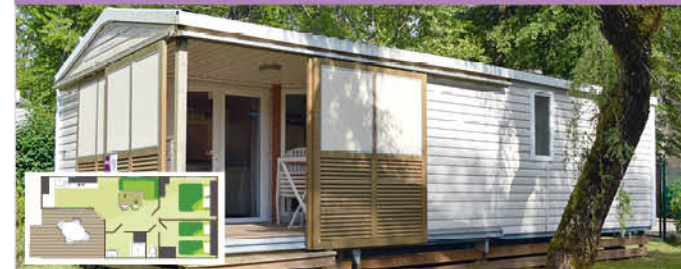
Soléo (30 m 2 - 0-7 ans) - 5 (+1) pers.

Prévus pour l'accueil de 5 (+1)pers. , 1 cuisine équipée : frigo congélateur, plaque gaz 4 feux, vaisselle, micro-onde, cafetière électrique, chauffage dans toutes les pièces, 1 salle de bain avec douche, lavabo, 1 WC séparé, 1 chambre avec 1 lit 140x190, 1 chambre avec 2 lits superposés et lit 1 pers. à côté. 1 salon, TV, coin séjour. 1 terrasse couverte avec brise vues coulissantes et salon de jardin.