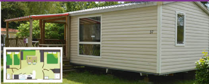
Premium (28 m 2 - 0-12 ans) - 4 (+1) pers.

Prévus pour l'accueil de 4 (+1) pers. 1 cuisine équipée : frigo, plaques gaz 4 feux, vaisselle, micro-onde, cafetière électrique, chauffage électrique. 1 salle de bain avec douche, lavabo (WC séparé). 1 chambre avec 1 lit 140x190. 1 chambre avec 2 lits 80x190. 1 salon, coin repas. 1 terrasse couverte avec salon de jardin.